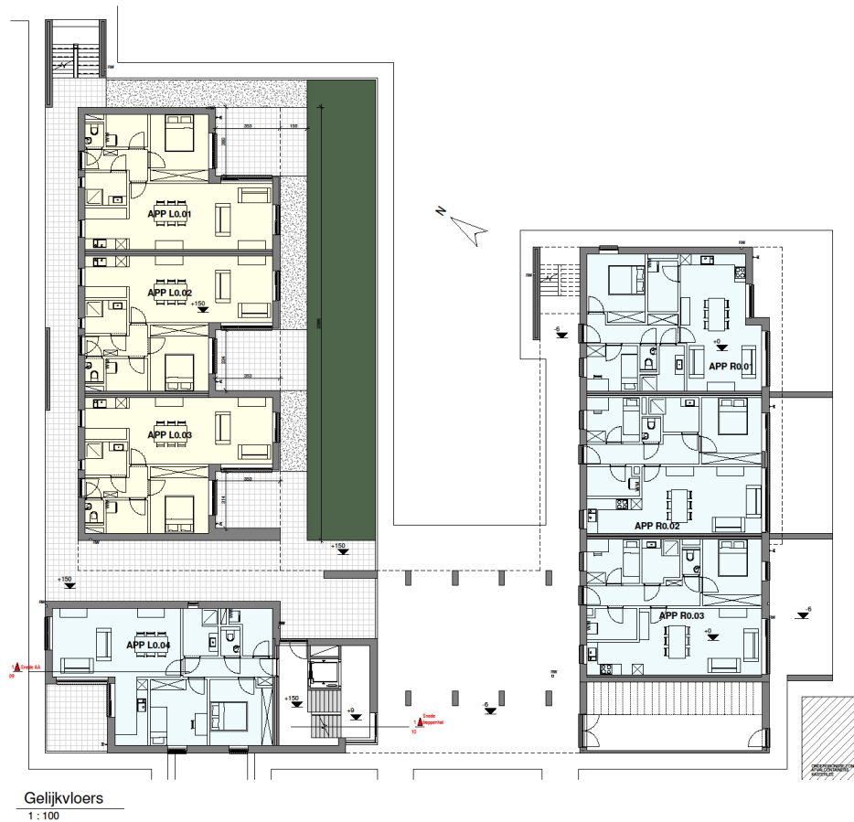
Gelijkvloers 1 : 100